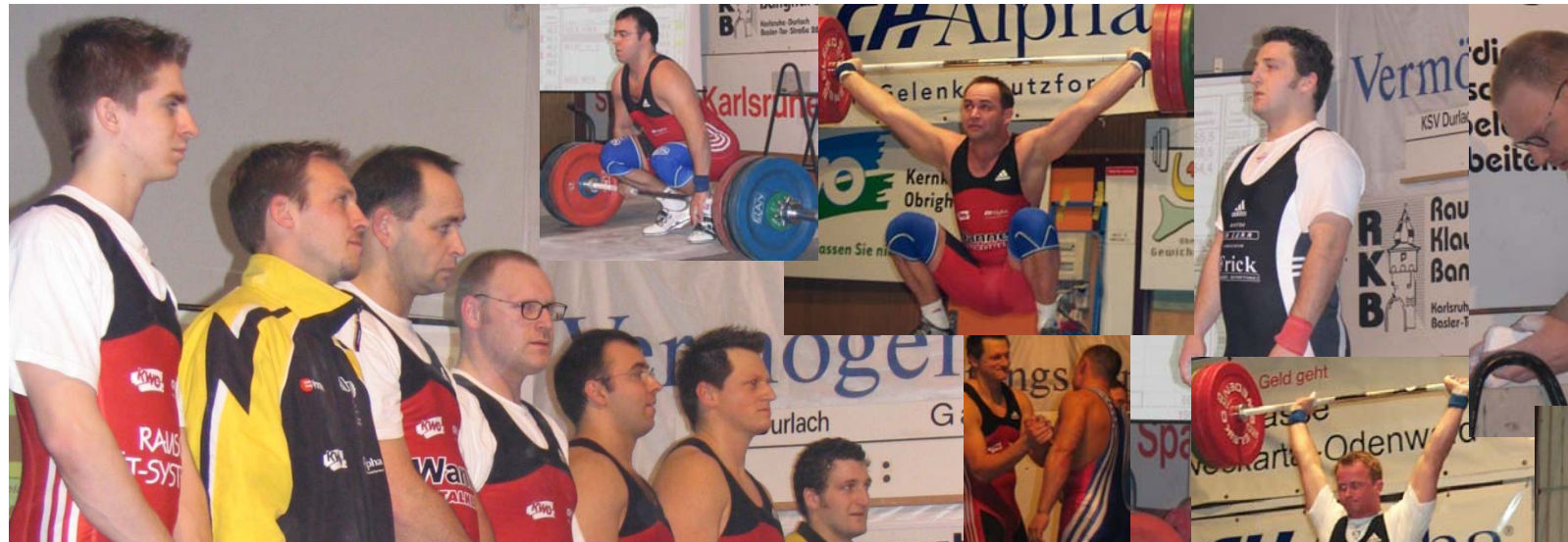
Eindrücke von den vergangenen beiden Wettkämpfen in Obrigheim und Durlach