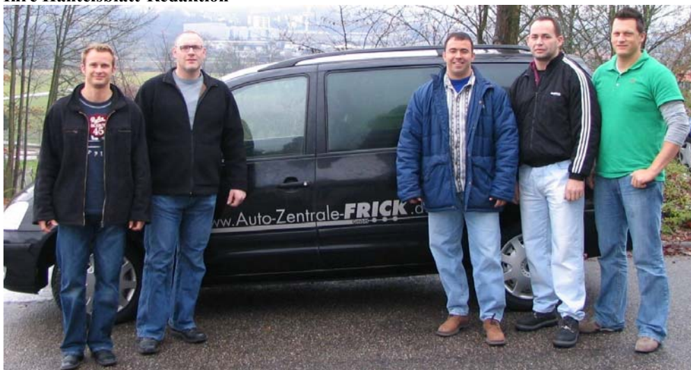
Der SV Germania Obrigheim bedankt sich an dieser Stelle recht herzlich bei der „AUTOZENTRALE FRICK“, die für die Fahrt zur DM nach Rodewisch ein Fahrzeug zur Verfügung stellte und somit den Obrigheimer Sportlern ein komfortable Anreise ermöglichte.