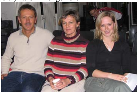
Die Obrigheimer Anhänger in Langen

Die erste Aufregung gab es dann aber doch schon vor der Abfahrt, nicht weil sich ein Heber verletzt hatte oder fehlte, sondern weil starker Schneefall und Verkehrsbehinderungen angesagt waren. Dies trat aber nicht ein und pünktlich kam die Obrigheimer „Delegation“, bestehend aus 7 Hebern, 2 Betreuern und 3 (in Worten drei) Fans in Langen an.