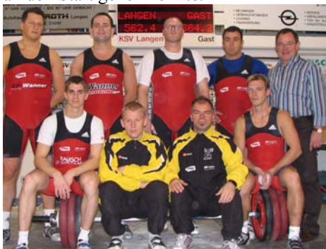
Die siegreiche Obrigheimer Mannschaft