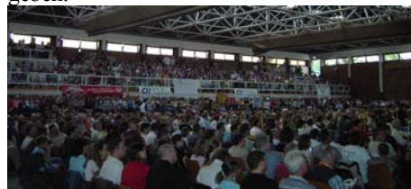
Obrigheims 7. Mann, das beste Gewichtheberpublikum in Deutschland, wurde nach dem Finale am 30.04.2005 bundesweit gelobt

Die Mannschaft hat in diesem Wettkampf die Erwartungen voll erfüllt und sie wird versuchen sich von Wettkampf zu Wettkampf zu steigern. Immerhin hat sie die drittbeste Leistung in ihrer Gruppe gebracht. Es wird mit Sicherheit spannender bei den Wettkämpfen zugehen als in den Vorjahren und es wird keine „langweiligen“ Kämpfe geben.