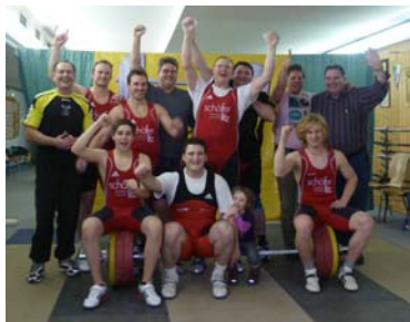
Freude nach dem Sieg gegen Heinsheim

Obrigheims „Zweite“ sicherte sich zum 2. Mal in Folge die Meisterschaft in der Oberliga. Mit 24:0 Punkten dominierte sie das Rundengeschehen und begeisterte mit einer tollen Moral. Gerade in engen Wettkämpfen zeigte sie ihre Klasse. Was der Gegner auch versuchte, sie wusste die passende Antwort. Lediglich dem späteren Vizemeister Flözlingen war es im Rückkampf gelungen, die Germanen etwas mehr zu fordern, doch aufgrund einer tollen Mannschaftsleistung konnte auch hier ein Punktverlust vermieden werden.