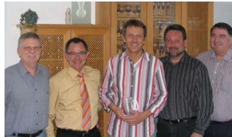
Die Spartenleitung der Obrigheimer Gewichtheber.

Durch seine ehrliche, offene und auch kritische Art war er der Wunschkandidat der Spartenleitung.