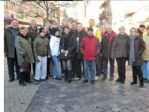
Alles in allem eine sehr gelungene Fahrt