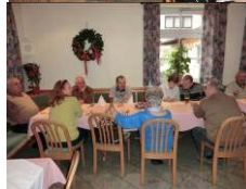
Allgemeine Sättigung bei Schweinebraten und Jägerschnitzel

Nach dem Mittagessen ging es nach Cham zur Stadtbesichtigung.