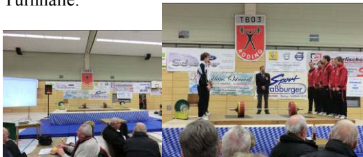
Blick auf die Wettkampfbühne