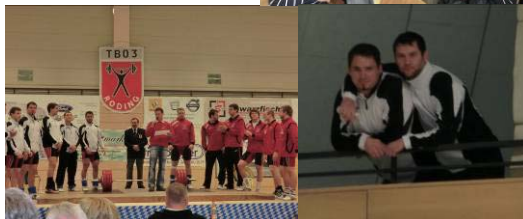
Nach dem erfolgreich verlaufenen Wett- kampf traf man sich zu einem geselligen Beisammensein.