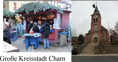
Große Kreisstadt Cham