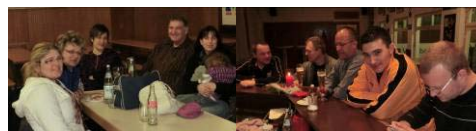
Ein Teil der mitgereisten Fans