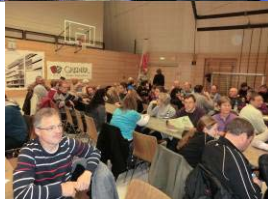
Die Fans in gespann- ter Erwartung