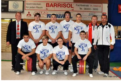
Das deutsche EM-Team

In der Bundesliga hast du schon einmal die Atmosphäre in der Neckarhalle erlebt. Auch als Ersatzmann warst du schon einige Male dabei. Kannst du das Gefühl „Gewichtheben in Obrigheim“ mal aus deiner Sicht beschreiben?