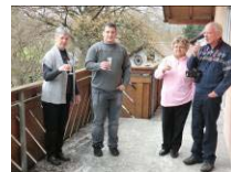
Ein erster Willkommenstrunk