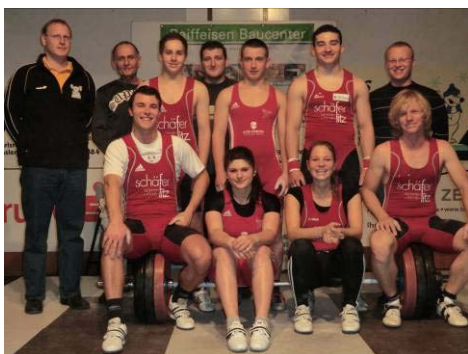
Obrigheims „Zweite“ Halbzeitmeister

Nach einem in keiner Phase der Partie gefährdeten 437,6 zu 220,4 Erfolg beim KSV Durlach befindet sich Obrigheims Zweite weiterhin auf Titelkurs. Aufgrund des Gewinns aller Disziplinwertungen konnte in der Fächerstadt ein klarer 3 : 0 Erfolg verbucht und damit die Tabellenführung in der Oberliga Baden-Württemberg verteidigt werden. Ungeschlagen und mit der Maximalausbeute von 12 Punkten darf sich die Mannschaft nun mit dem inoffiziellen Titel des Halbzeitmeisters schmücken.