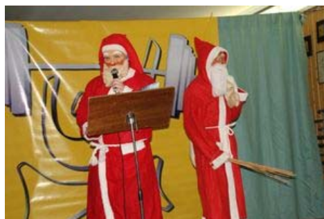
Der Nikolaus und sein Knecht Ruprecht

Zum Abschluss ließen es sich der Nikolaus und sein Knecht Ruprecht nicht nehmen, allen Danke zu sagen und ihnen ein großes Lob für ihren Einsatz und ihre Erfolge auszusprechen. In seinem „Plädoyer“ fand er zu jedem Athleten in humorvoller Weise die passenden Worte und vergaß auch nicht, jedem ein Geschenk zu überreichen.