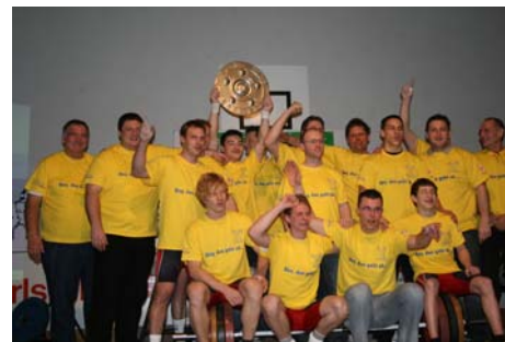
SV Germania Obrigheim II: Meister der Oberliga Baden- Württemberg