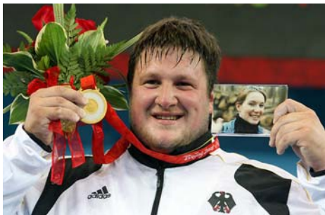
Matthias Steiner nach seinem Olympiasieg im Superschwergewicht.

Dem lettischen Team um Europameister Scerbathis unterlief ein weiterer taktischer Fehler. Anstelle der für die Führung notwendigen 255 kg ließen die Balten 257 kg auflegen. Scerbathis scheiterte an der Last belegte so den dritten Platz.