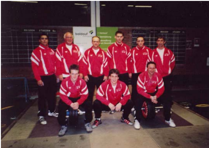
Das Team des VfL Duisburg-Süd:

Sollte sich der Verein nicht enorm verstärken, wird er den SV Germania Obrighem bei seiner Mission Titelverteidigung wohl kaum ernsthaft gefährden können.