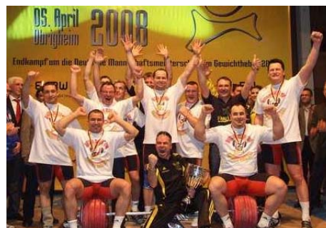
Die siegreiche Obrigheimer Mannschaft.